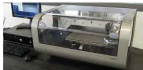
IMPRESSION JET D'ENCRE CONDUCTRICE