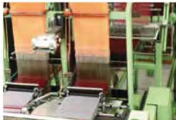
MÉTIER À TISSER BANDE ÉTROITE