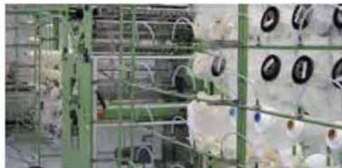
MÉTIER À TRICOTER CHAÎNE