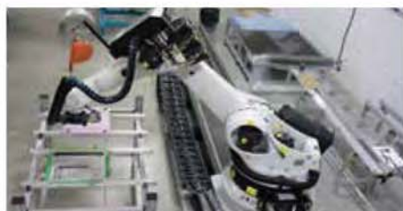
TECHNOLOGIES DE PRODUCTION DE PRÉFORMES SÈCHES POUR COMPOSITES