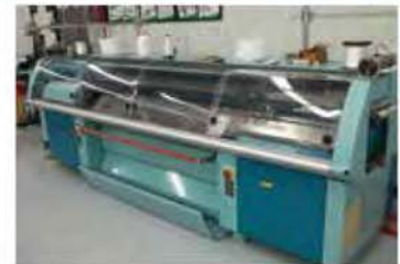
MÉTIER À TISSER RECTILIGNE : FULLY FASHION