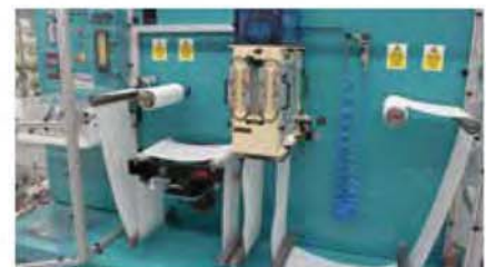
PLASMA PRESSION ATMOSPHÉRIQUE