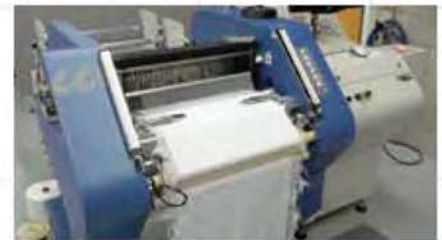
MÉTIER À TISSER D'ÉCHANTILLONNAGE 20"