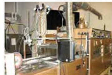
RAME DE FINITION