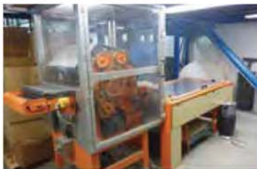
LIGNE PILOTE NON-TISSÉ