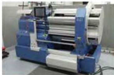
OURDISOIR À BOBINE UNIQUE