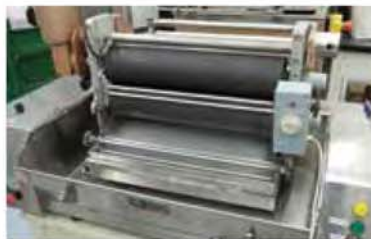
FOULARDAGE / ENDUCTION / VAPORISATION