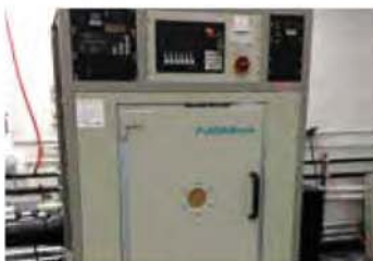
PLASMA BASSE PRESSION